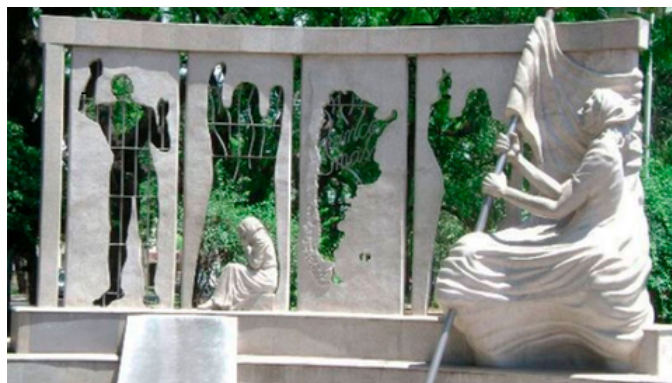
Escultura "Memoria" - Obra de Amanda Mayor emplazada en Plaza Sáenz Peña, Paraná, en 1995.

El Estado Terrorista no se limitó a eliminar físicamente a su enemigo político sino que, a la vez, pretendió sustraerle todo rasgo de humanidad, adueñándose de la vida de las víctimas y borrando todos los signos que dieran cuenta de su paso por el mundo: su nombre, su historia y hasta su propia muerte.